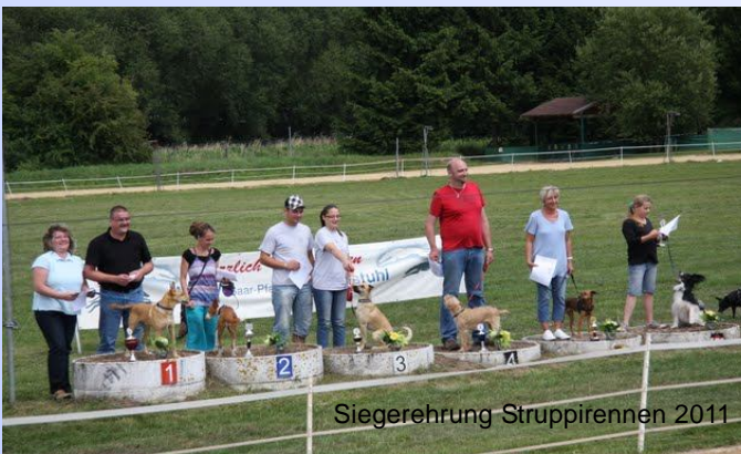
Siegerehrung Struppirennen 2011

Einteilung in drei Größenklassen. Es werden je zwei Läufe absolviert; Wertung der schnellsten Zeit. Vor Anmeldung erwünscht! Anmeldung siehe Homepage!